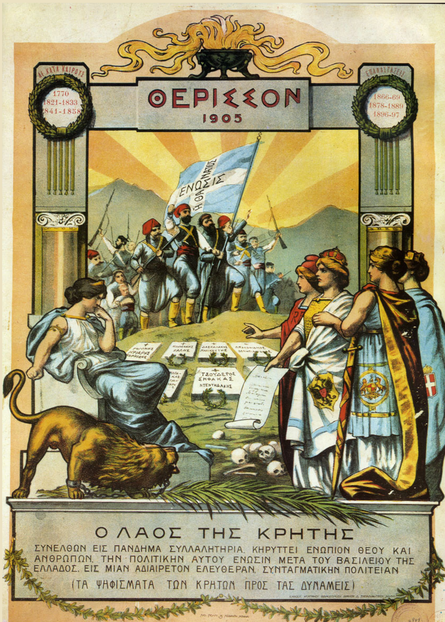
Λαϊκή λιθογραφία της εποχής όπου αποτυπώνεται το αίτημα της Επανάστασης του Θερίσου για ένωση της Κρήτης με την Ελλάδα