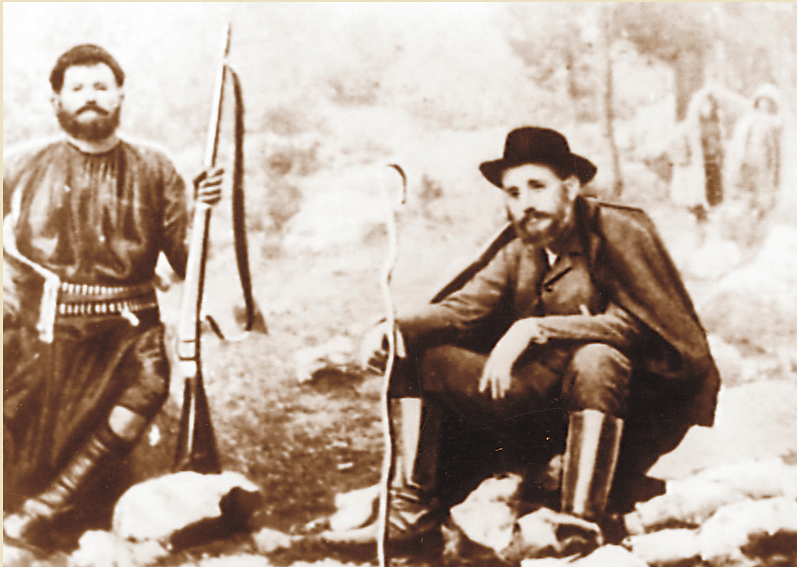
Ο Ελευθέριος Βενιζέλος στο Θέρισο