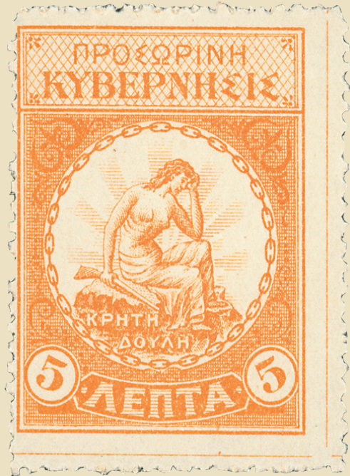
Γραμματόσημα της Επαναστατικής Κυβέρνησης του Θερίσου, δείγμα κρατικής οντότητας της επαναστατικής αρχής