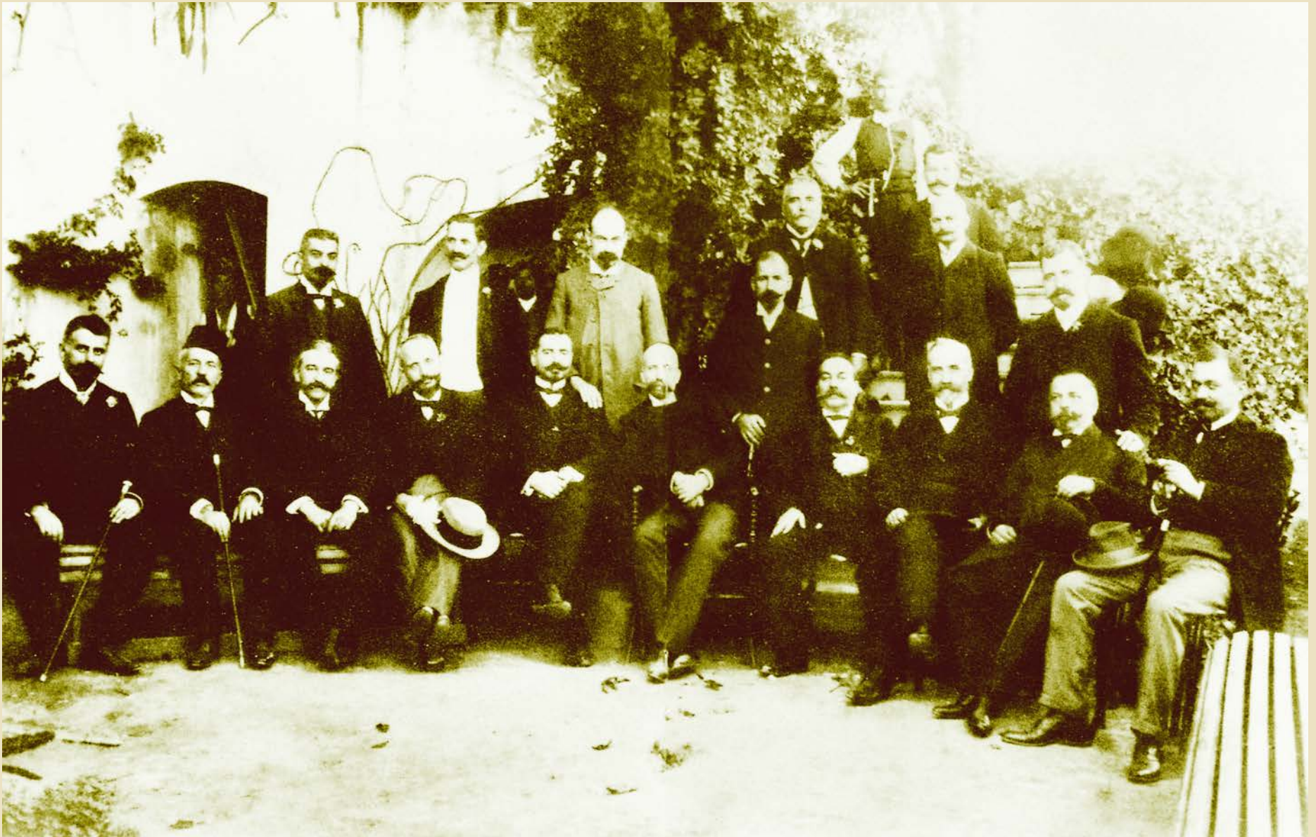
Η επιτροπή σύνταξης του σχεδίου του νέου (Β') Συντάγματος της Κρητικής Πολιτείας, 1906-1907. Μεταξύ των πληρεξουσίων διακρίνεται ο Ελευθέριος Βενιζέλος, ο οποίος υπήρξε ο εμπνευστής θεμελιωδών διατάξεών του