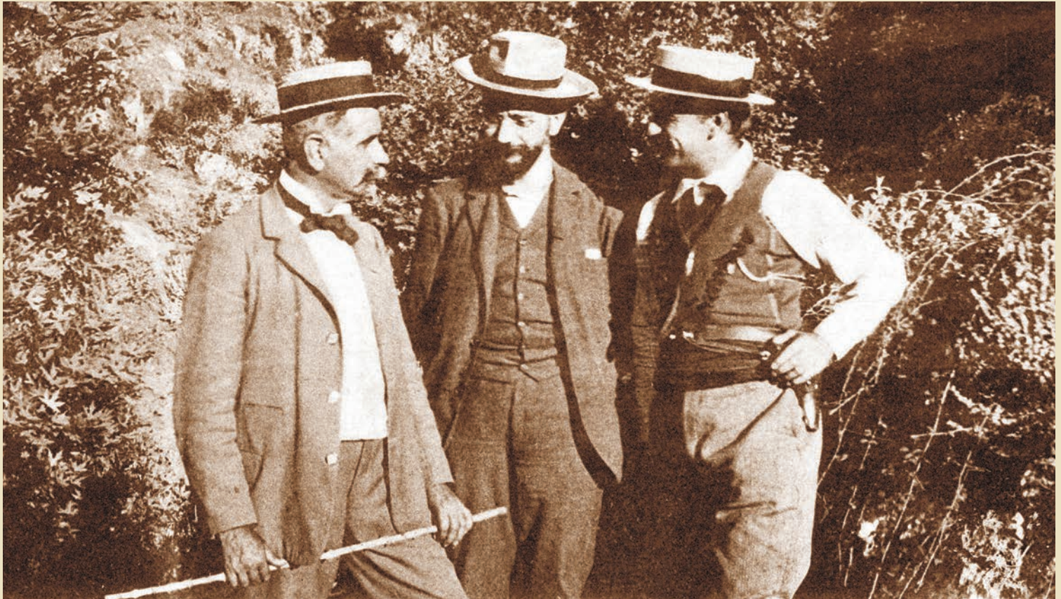
Η τριανδρία του Θερίσου, Κωνσταντίνος Φούμης, Ελευθέριος Βενιζέλος και Κωνσταντίνος Μάνος