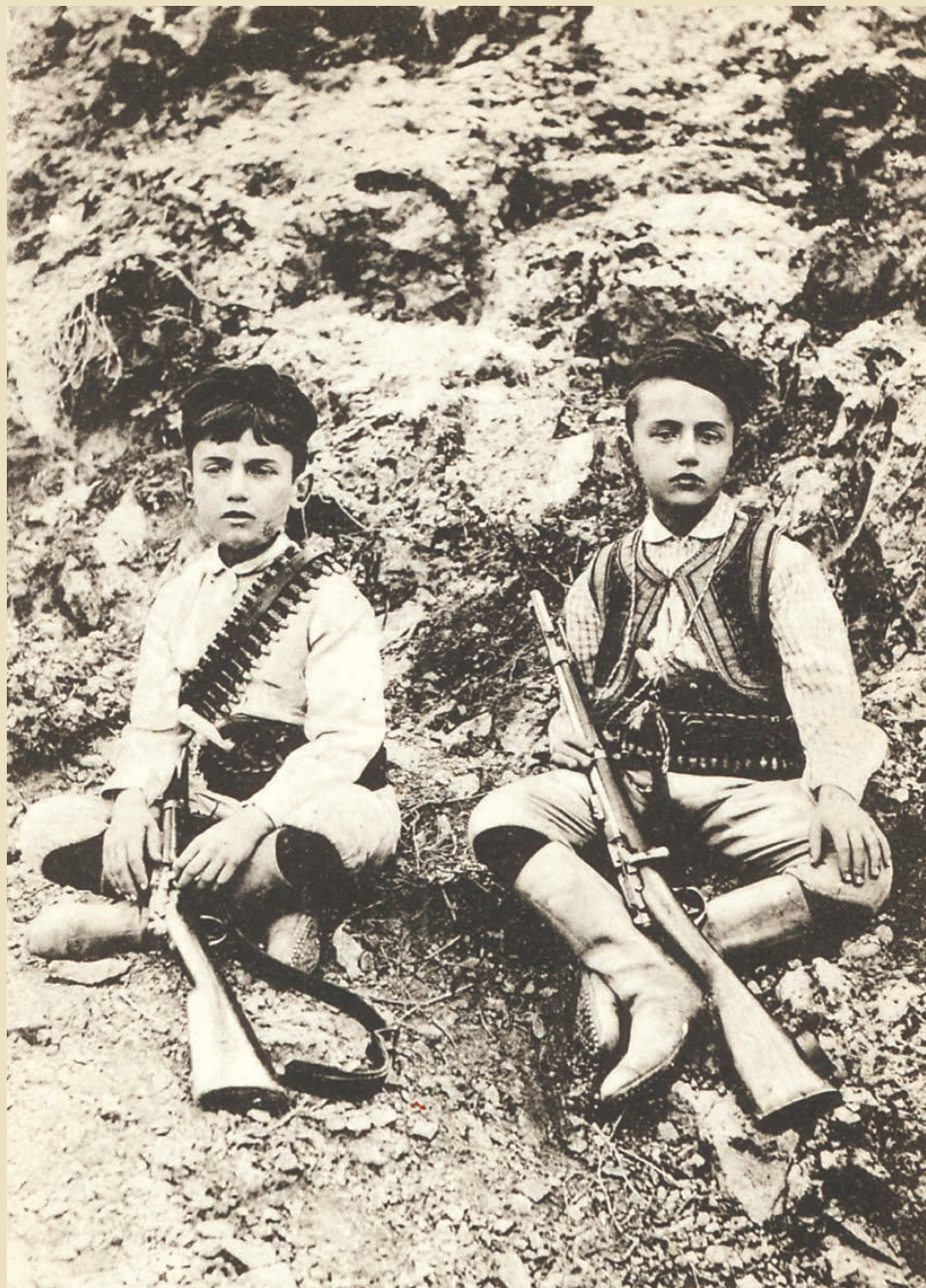
Οι γιοι του Βενιζέλου, Κυριάκος και Σοφοκλής, στο Θέρισο