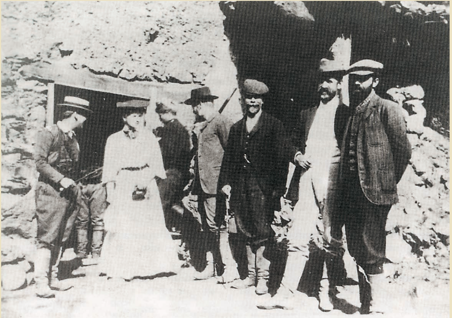
Ο Ελευθέριος Βενιζέλος με εκπρόσωπο του ξένου Τύπου και επαναστάτες στο Θέρισσο